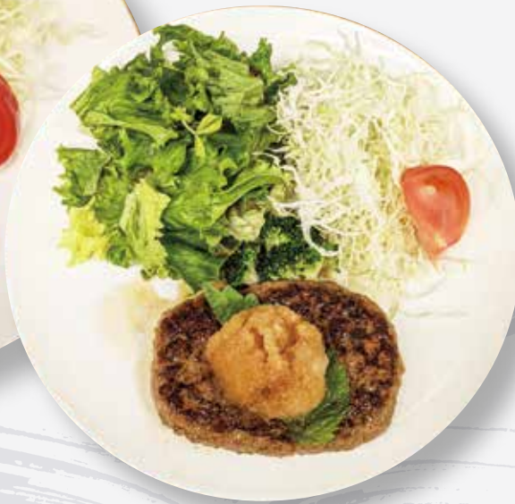
和風ハンバーグ定食