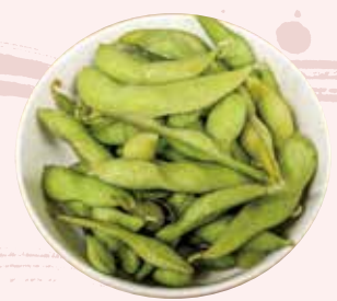
枝豆 330 円 (税込)