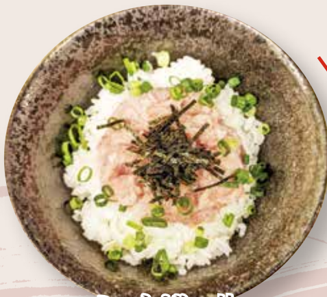
ミニネギトロ丼 750 円 (税込)