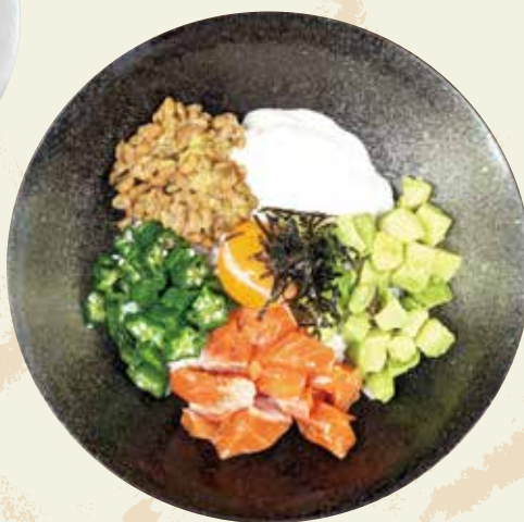
サーモンのねばねば丼 ワインたまご使用 1,150円(税込)