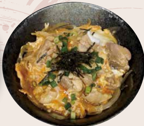
ミニ親子丼 550 円 (税込)