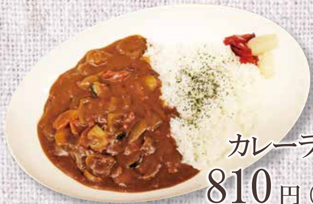
カレーライス 810円(税込)