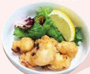
たこ唐揚げ 600 円 (税込)