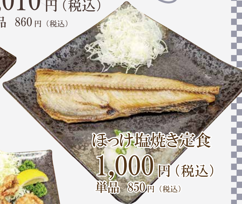
ほっけ塩焼き定食