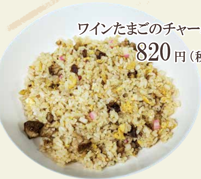
ワインたまごのチャーハン 820円(税込)