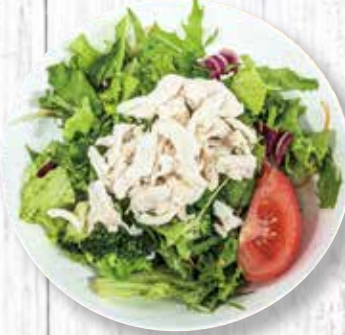
ささみサラダ 550 円 (税込)