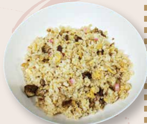
ワインたまごのミニチャーハン 550 円 (税込)