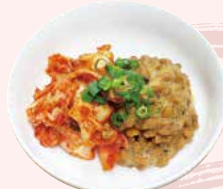
キムチ納豆 350 円 (税込)