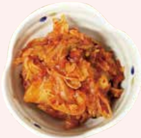
キムチ 200 円 (税込)