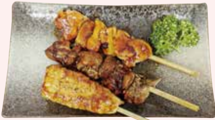
焼き鳥 (タレ / 塩) 380 円 / 380 円 (税込)