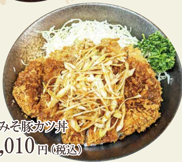
ネギみそ豚カツ丼 1,010円(税込)