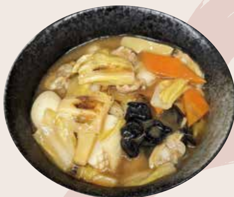
ミニ中華丼 550 円 (税込)