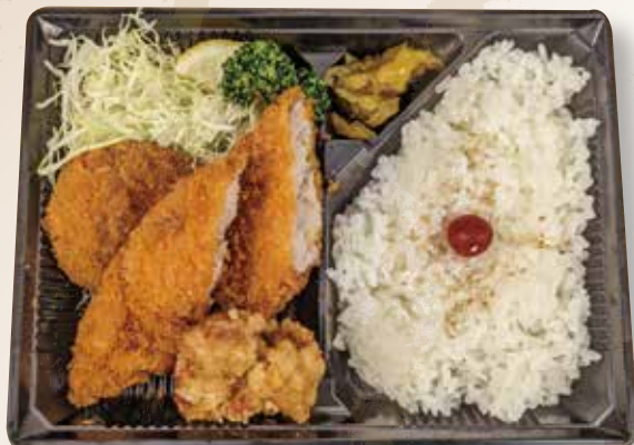
ミックスフライ弁当 730円 (税込)