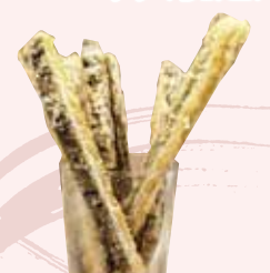
ごぼうスティック 450 円 (税込)