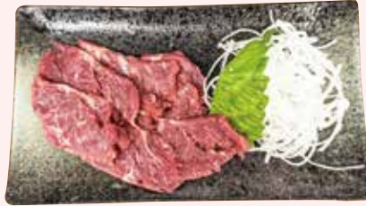
馬刺し 670 円 (税込)