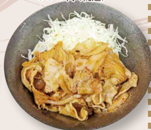
ミニ豚キムチ丼 550 円 (税込)