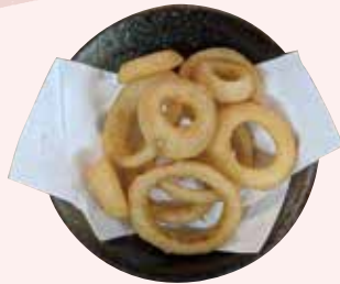
オニオンリング 450 円 (税込)