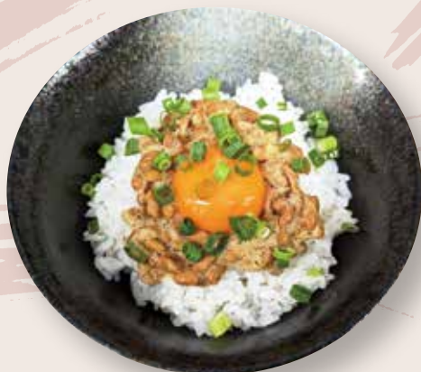
ミニ納豆丼 ワインたまご使用 400 円 (税込)