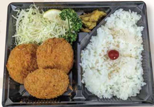
ミニメンチカツ弁当 600円 (税込)