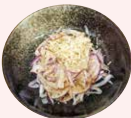
オニオンスライス 330 円 (税込)