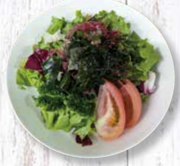
海藻サラダ 550 円 (税込)