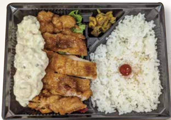
チキン南蛮弁当 930円 (税込)