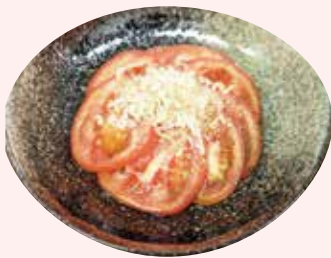
トマトスライス 330 円 (税込)