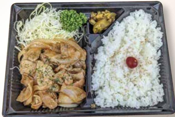
生姜焼き弁当 730円 (税込)