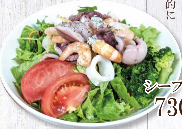
シーフードサラダ 730 円 (税込)