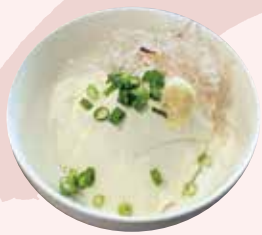
冷奴 350 円 (税込)