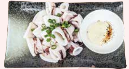
ゆでイカ 450 円 (税込)