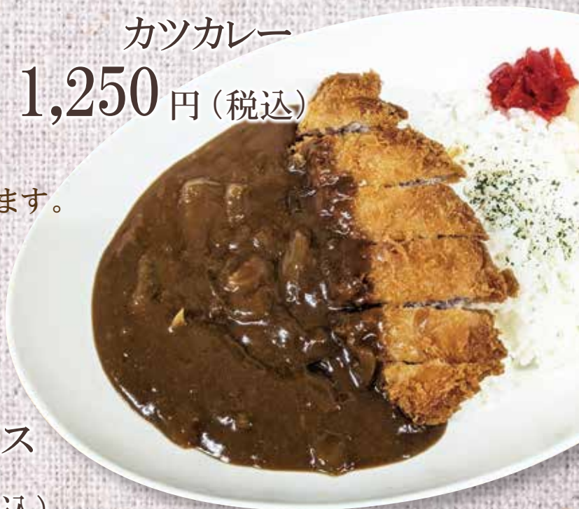
カツカレー 1,250円(税込)