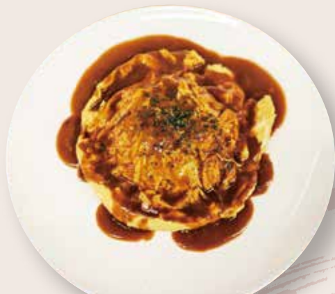
ワインたまごのミニオムライス 650 円 (税込)