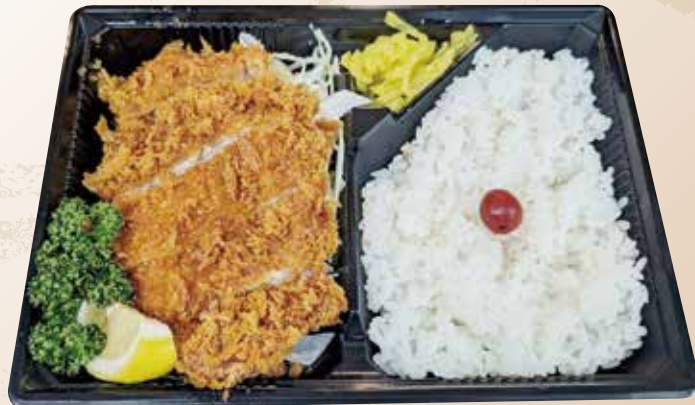
上ロースカツ弁当 1,200円 (税込)