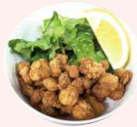
軟骨の唐揚げ 500 円 (税込)