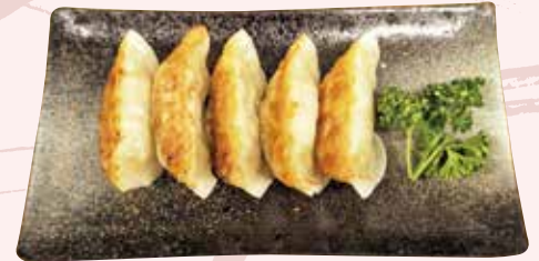
ギョーザ 430 円 (税込)