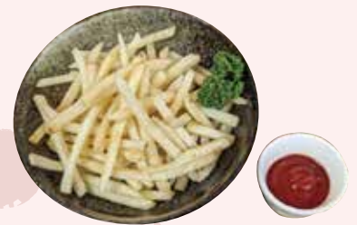
ポテトフライ 430 円 (税込)