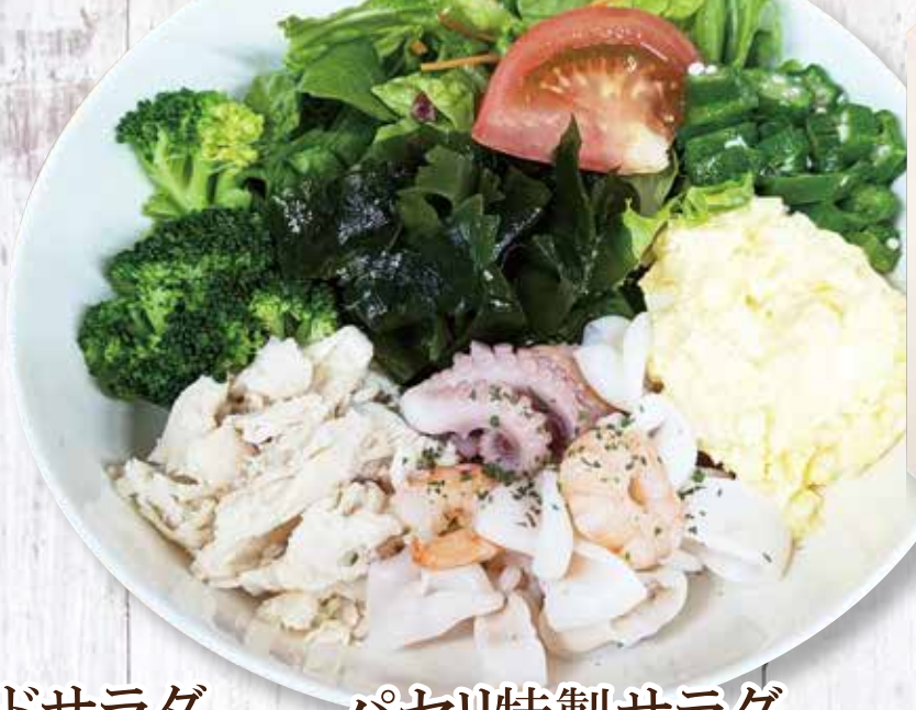
パセリ特製サラダ 930 円 (税込)