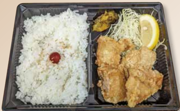
唐揚げ弁当 (4個入り) ※数量限定 ※他の割引とは 重複できません 限定特別価格 390円 (税込)

※お弁当は受け取り後30分以内にお召し上がりください。 ※ライスの代わりに無料でサラダに変更できます。 ※+80円でご飯を雑穀米に変更できます。