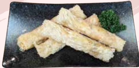
海老入りスティック春巻き 740 円 (税込)