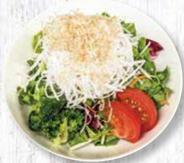
大根サラダ 450 円 (税込)