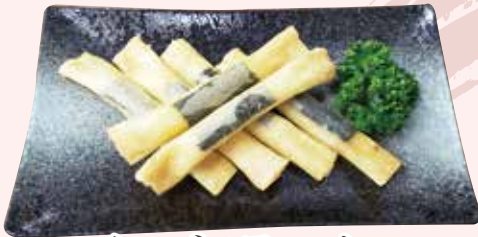
チーズスティック 545 円 (税込)