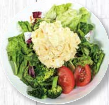
たまごサラダ 450 円 (税込)