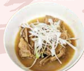
馬もつ 550 円 (税込)