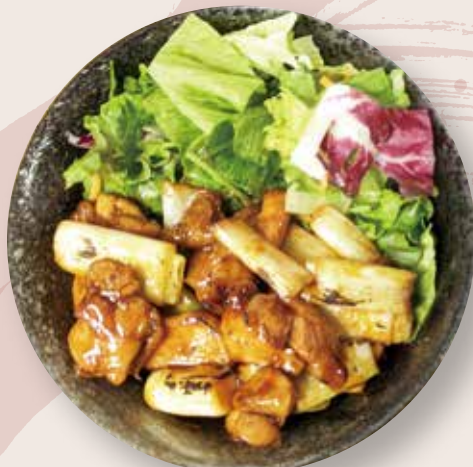
ミニ焼き鳥丼 550 円 (税込)