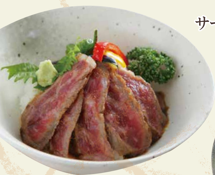
ワインビーフのステーキ丼 1,500円(税込)